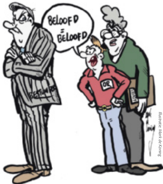
Illustratie: Mark de Koning